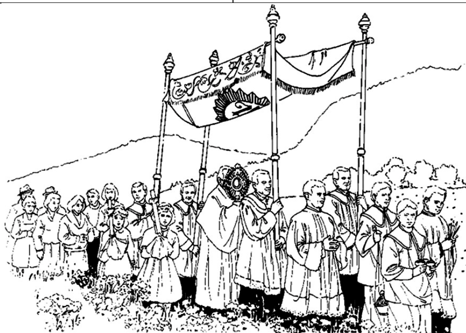
Rys. 3. Procesja Bożego Ciała