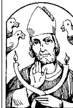
Sw. Błażej 3 lutego

Nasza parafia ma wyjątkowe wezwanie. Jej patronami, a zarazem naszymi są Wszyscy Święci . Nasze Pismo SANCTUS (co po łac. znaczy święty) od samego początku stara się przybliżać swoim czytelnikom sylwetki 'mieszkańców nieba'. Wśród nich znajdują się osoby, o których większość z nas pewnie nigdy nie słyszała. Naszą kolejną inicjatywą jest nowy Dodatek – Święci na co dzień , który bardzo skrótowo będzie prezentował świętych i błogosławionych z danego miesiąca wraz z ich wizerunkami.