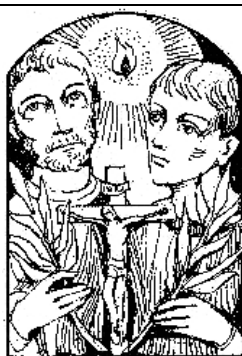
Sw. Faustyn i Jowita 15 lutego

Ur. pod koniec XII w. w Westfalii, zm. w 1237 r.; zakonnik, pierwszy następca św. Dominika, prezbiter; w ciągu 15 lat z 30 konwentów pomnożył liczbę do 300, a liczbę współbraci z 300 powiększył do 4000.