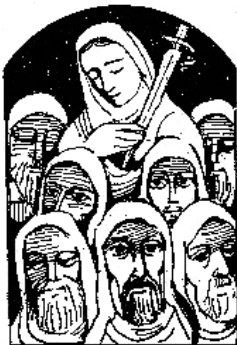
Sw. Konrad 19 lutego

Aleksy Falconieri, Bartłomiej Amidei, Benedykt Antella, Buonfiglio Monaldi, Gerardino Sostegni, Hugo Lippi-Ugucioni oraz Jan Buonagiunta Monetti; założyli w 1233 r. zakon po objawieniach Maryi.