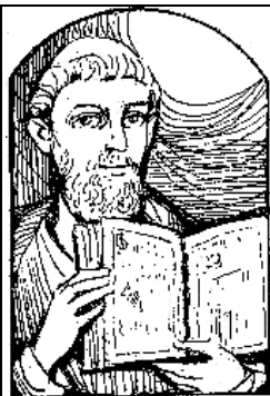
Bł. Jordan 13 lutego

Ur. pod koniec XII w. w Westfalii, zm. w 1237 r.; zakonnik, pierwszy następca św. Dominika, prezbiter; w ciągu 15 lat z 30 konwentów pomnożył liczbę do 300, a liczbę współbraci z 300 powiększył do 4000.