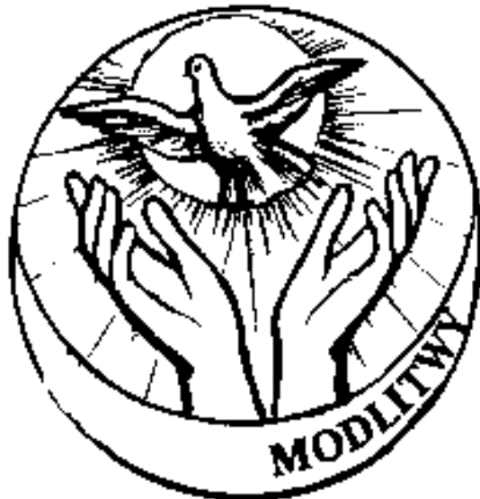
Rys. 3. Modlitwa