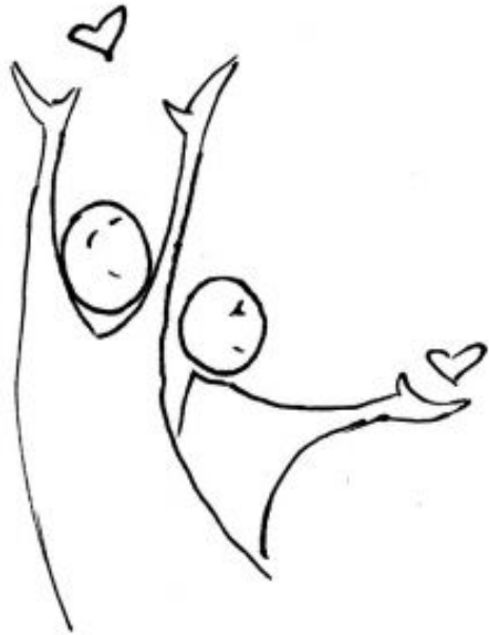
Rys. 2. Dobroczynność

Kiedy Wielki Post przychodzi Okres zabaw w bok odchodzi, Bo to czas przygotowania Do wielkiego świętowania. Polega on na poszczeniu, Jałmużnie, częstszym modleniu. Te postawy u człowieka Czynią, że w miłości czeka. Ćwiczy wolę, dobro daje I z Bogiem się nie rozstaje. Tak jak Jezus na pustyni Czterdzieści dni się to czyni. Później przyjdzie czas radości Pełen chwały i wdzięczności. Tak też z życiem jest człowieka, Który na zbawienie czeka. Gdy na ziemi dobrze żyje Bóg przed nim nieba nie skryje. /KP/