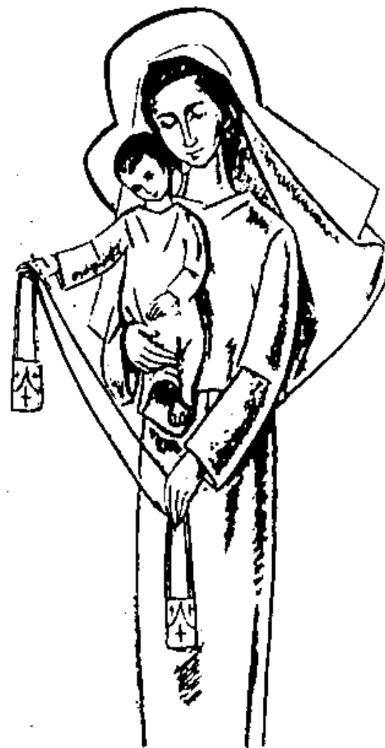
Rys. 1. Najświętsza Maryja Panna z Góry Karmel

Dodatek dla młodszych nr 8 (lipiec 2011)