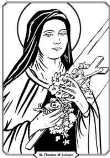
Rys. 2. Karmelitanka – św. Teresa z Lisieux