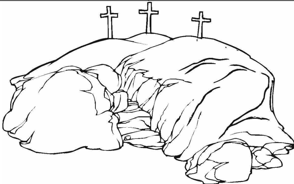
Rys. 3. Golgota

Prawda rymowana... Nadeszła godzina męki Bóg zabity z ludzkiej ręki. Ojciec za grzechy każdego Oddał Syna Jedynego. Pierw w ogrodzie Go schwyтали Później przed sądy zabrali. Po skazaniu biczem zbili A na głowę cień włożyli. Z ciężkim krzyżem na śmierć gnany Przez lud wkoło wyśmiewany. Na Golgotę wprowadzony Ze zbrojami był stracony. Przez to wszystko co się stało Zbawienie się dokonało, A Pan Jezus umierając swoim zabójcom przebacząc Dał przykład jak kochać trzeba Aby dostać się do nieba. /KP/