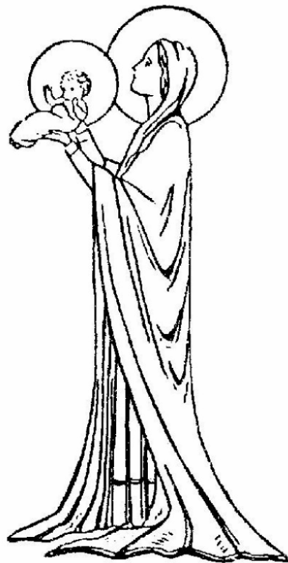
Rys. 2. Maryja ofiarująca Jezusa

Józef z Marią Prawo znali Bogu Dziecię swe oddali. Mały Jezus był zabrany W świątyni ofiarowany. Razem z synogarlicami W darze Panu nad Panami. Spotkali się z Symeonem Ujrzał Mesjasza przed zgonem. Jak potrafił Boga chwalił, Że narody swe ocalił. Oprócz niego w tej świątyni Była Anna Prorokini, Która Stwórcę uwielbiła, Bo Jezusa zobaczyła. Dziś też ludzie się oddają Bogu życie poświęcają I z zakonnymi ślubami Kroczą Jezusa śladami /KP/