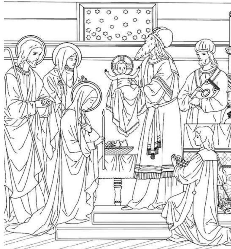
Rys. 1. Józef z Maryją ofiarują Jezusa w świątyni