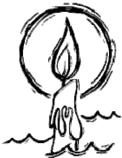
Rys. 3. Świeca gromniczna